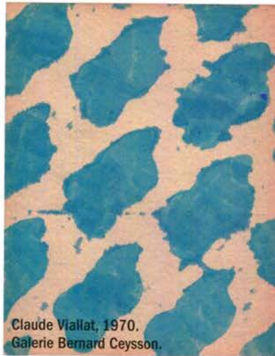
Claude Viallat, 1970. Galerie Bernard Ceysson.