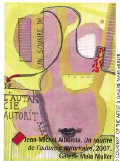
Jean-Michel Alberola. Un sourire de l'autarcie autoritaire , 2007. Galerie Maïa Muller