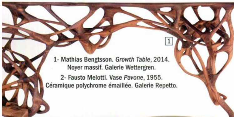
1- Mathias Bengtsson. Growth Table , 2014. Noyer massif. Galerie Wettergren. 2- Fausto Melotti. Vase Pavone , 1955. Céramique polychrome émaillée. Galerie Repetto.

de son époque et au fait de l'art de vivre. Avec passion, les organisateurs et les spécialistes de la commission des objets, dont Antoine Laurentin et François Laffanour, rassemblent les plus grands collectionneurs internationaux et réussissent à chaque édition l'exploit d'initier des dialogues inédits entre l'art moderne, le design historique et contemporain, les bijoux, les arts premiers. Le monde entier se rend donc à ce parcours exceptionnel du "Beau" dans son écrin toujours esthète et intimiste où chaque marchand propose aux collectionneurs les pièces les plus exceptionnelles et les plus pertinentes. Le prix PAD 2016, présidé par Jean-Michel Wilmotte, accompagné entre autres par Philippe Starck, Olivier Gabet et David Caméo, directeur et président du musée des Arts décoratifs ou Guy Cogeval président du musée d'Orsay, récompense une œuvre qui sera intégrée aux collections des Arts décoratifs. Et pour ses vingt ans, du côté français, la superbe galerie Kreo revient au salon accompagnée par la très douée Meubles et Lumières et la très pointue Leclair.